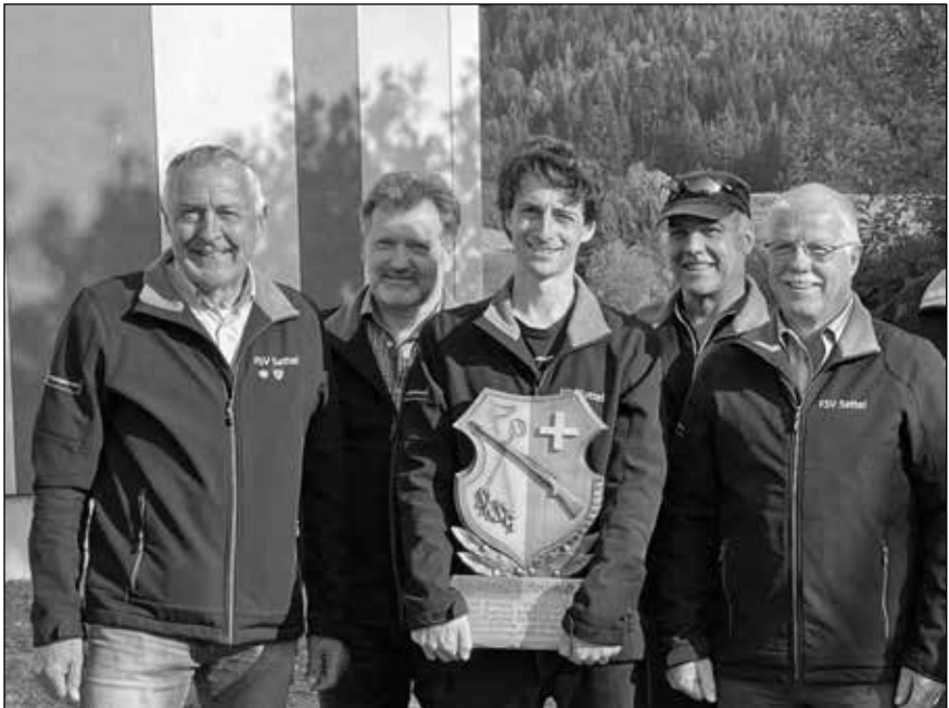
Kantonaler Gruppenmeister im Feld D: die Stgw-Schützen des FSV Sattel

Die ersten 11 Gruppen gelangten in die Schweizerischen Hauptrunden.