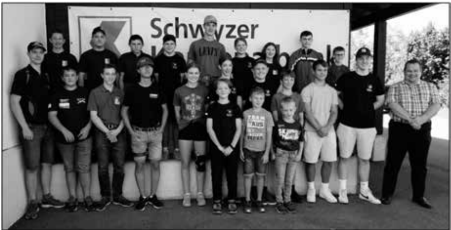
Alle Finalteilnehmer mit Regierungsrat Xaver Schuler (rechts)

Auch in diesem Jahr konnten sich die Schützen der Kategorien U13, U15 und U17 im August am SZKB-Jugendschiessen wieder sportlich messen. Es war uns eine Ehre, verschiedene Gäste, darunter auch Regierungsrat Xaver Schuler zum Absenden begrüßen zu können. In diesem Jahr waren die Jahrgänge 2007 bis 2013 für das Jugendschiessen zugelassen. Das zu absolvierende Programm war wie folgt: 3 Schuss Probe A6 / 5 Schuss Einzel A6 + Treffer = 35 P