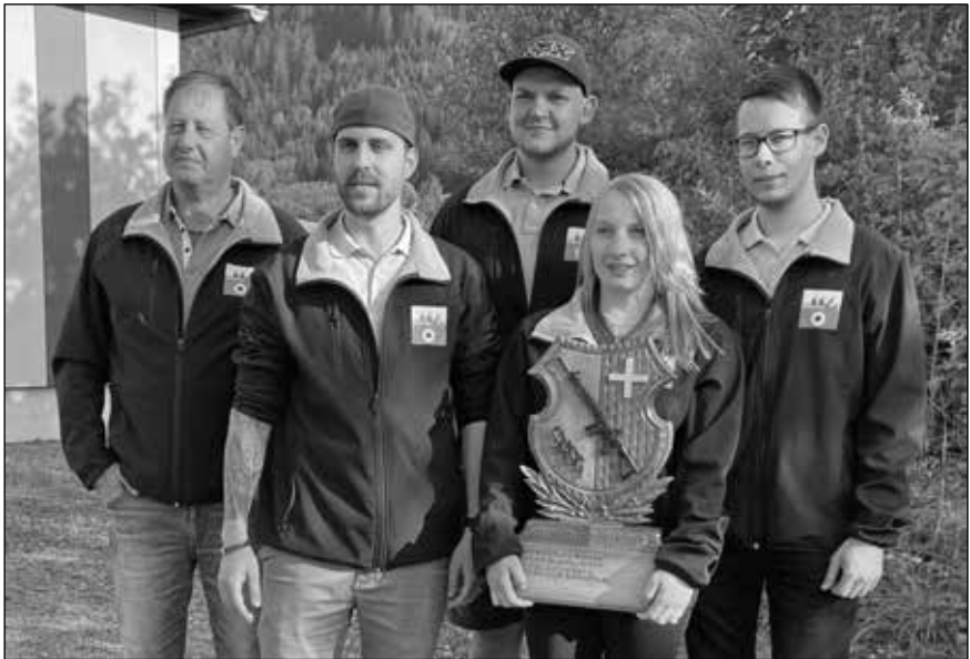
Kantonaler Gruppenmeister im Feld E: die Stgw-Schützen der FSG Burg-Schwyz

Die ersten 11 Gruppen gelangten in die Schweizerischen Haupttrunden.