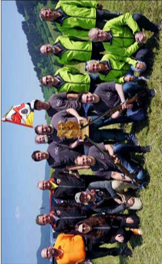
v.l.n.r.: SV Wollerau, Kantonalmeister SV Ibach-Schönenbuch, FSG Ried-Muotathal