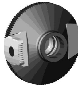
Bild 6: Rondelle für Farbfilereinsatz an Irisblende zu Stgw 90 diverse Fabrikate