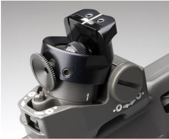
Bild 4: Excenter-Farbfiler mit Schiebekassette zu Stgw 90, Modell Grünig & Elmiger; Modell Wyss ähnlich