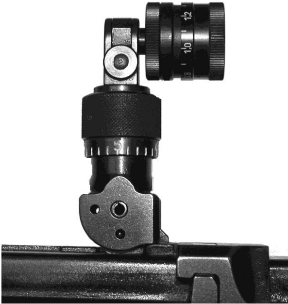
Bild 8: Irisblende zu Stgw 57 (mit und ohne Farb- und Polarisationsfilter), diverse Fabrikate