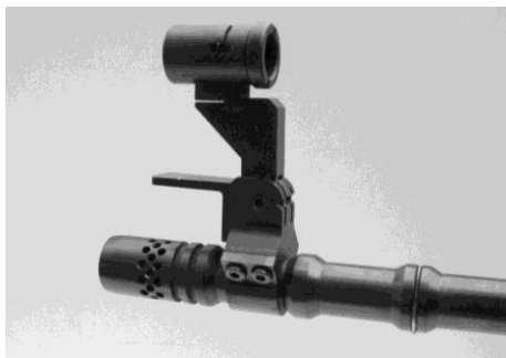
Bild 10: Kornträger als Visierverlängerung (Laufmontage), diverse Fabrikate

Die Montage muss zwingend durch den Hersteller oder durch den Fachhandel erfolgen.