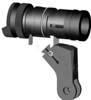
Bild 9: Universalkornträger zu Stgw 57 (Normalmontage) diverse Fabrikate