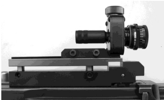
Bild 12: Diopterträger zu Stgw 57 zur Aufnahme schussfester Diopter diverse Fabrikate